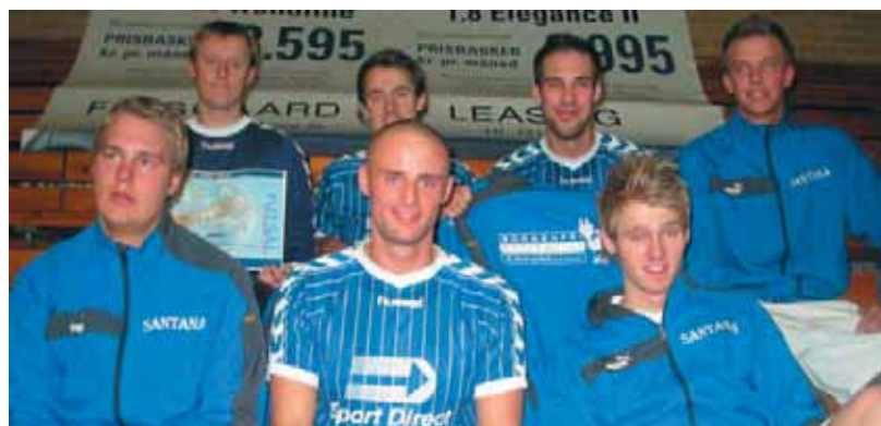
Roskilde Santana satte sig også på førstepladsen i Helsingør Firma Idræts stævne i futsal, og har nu vundet ikke færre end seks stævner på Sjælland.