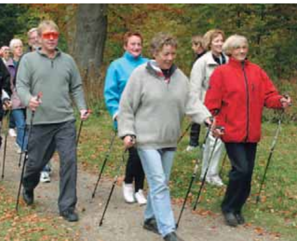
Idræt om Dagen i Silkeborg sætter fokus på stavgængere i LøbeTouren i 2007.

LøbeTouren er både løb, rulleskøjter og stavgang.