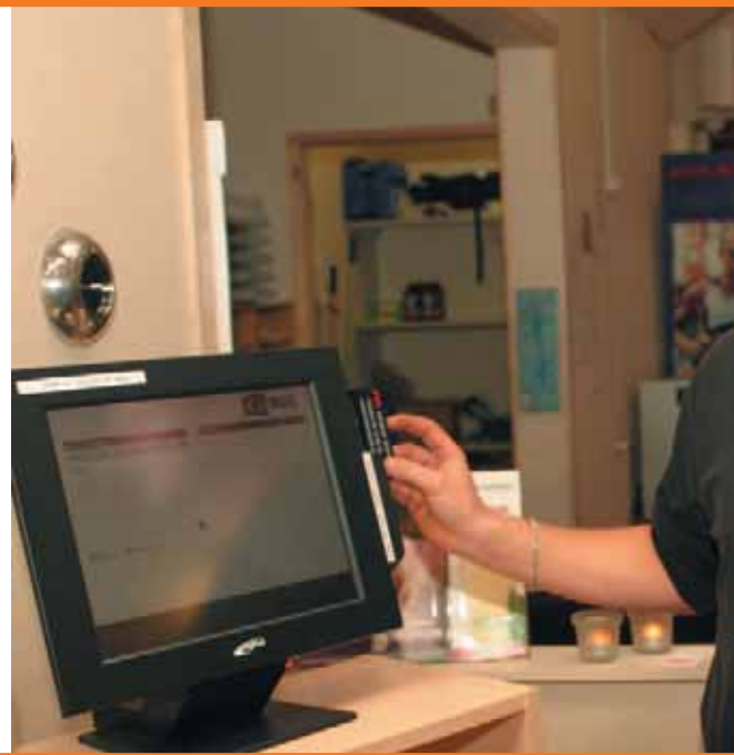
Alle medlemmer tjekker ind med et elektronisk medlemskort, hvor man kan se alle de aktiviteter de bruger i Fitness Struer.