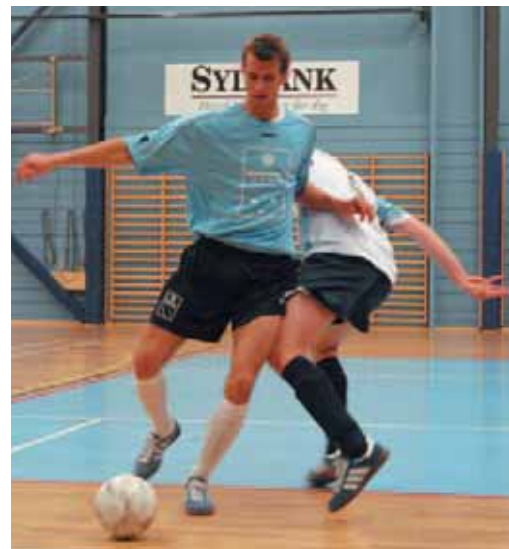
Firmaholdet fra Demskov-EL tabte semifinalen med 2-1 i en jævnyrdig og tæt kamp.