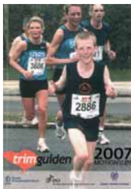
Årets store motionsguide, Trimguiden 2007 er på gaden og kan bestilles på www.trimguiden.dk

Årets store motionsguide, Trimguiden 2007 er på gaden. Den 4. udgave af Trimguiden indeholder en udførlig oversigt over mere end 700 motionsarrangementer for løbe-, cykel- og stavgangsmotionister. Trimguiden er på 320 sider og koster kr. 65,00 (ekskl. forsendelse). Se også Trimguiden online på www.trimguiden.dk