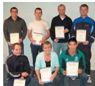
Syv nye fitness-instruktører i DFIF.

DFIF ønsker alle tillykke og håber, at alle vil gå ud og sprede deres viden og gode initiativer til foreninger og arbejdspladser.