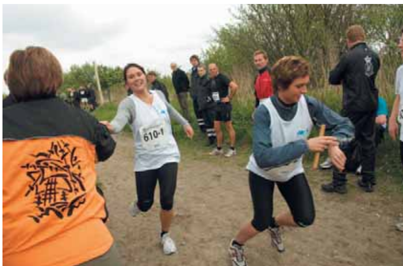
Kombinationen med motionsløb og besøg i wellness-afdelingen i Svømmeland gav succes i 2006.