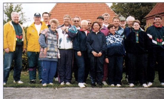
Kursister og instruktører samlet til det første petanque II kursus i DFIF.

Søndag morgen var der atter tid for en test for at se om vore resultater var blevet forbedrede. Det var de stort set over hele linien, endda meget for fleres vedkommende.