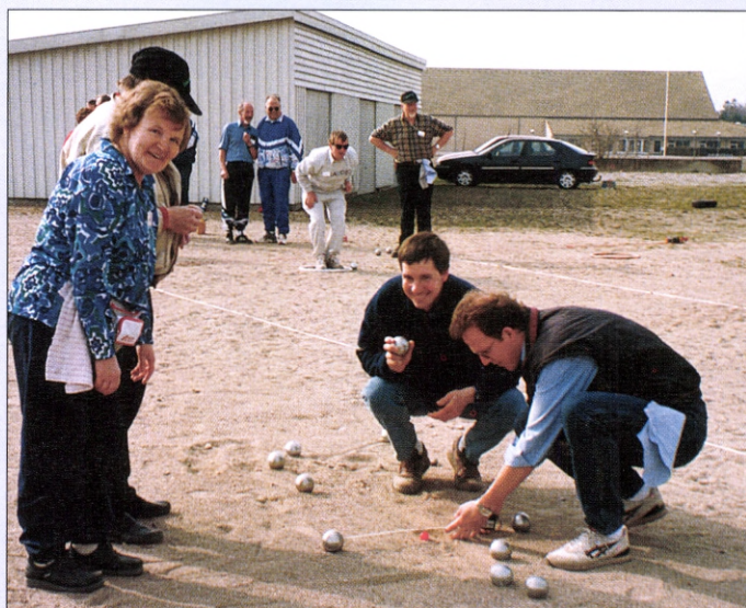
Målebåndene blev brugt flittigt under den spændende turnering om søndagen.