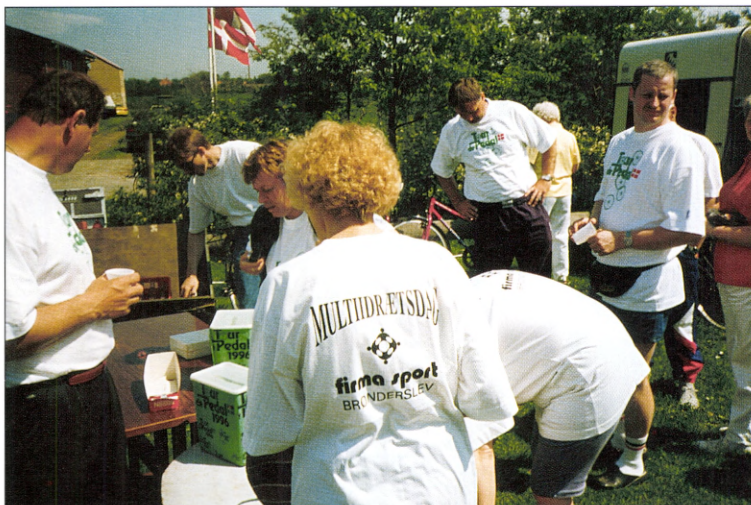
Et af de mange ekstra tilbud var en specialudgave af Tour de Pedal der samlede 30 motionscyklister til en solbeskinnet rundtur i Brønderslev på 13 km.