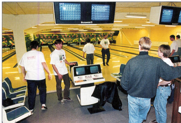
Deltagerne i DFIF's Østersøtræf får lejlighed til at afprøve færdighederne på bowlingbanen.

Østersøtræffet afvikles i weekenden den 13.-15. september, og deltagerne får således mulighed for at følge DFIF's sommerlandsstævner i fodbold, håndbold, skydning, dart og petanque, der finder sted i København samme weekend. Programmet vil veksle mellem teori og aktiv idrætsudfoldelse.