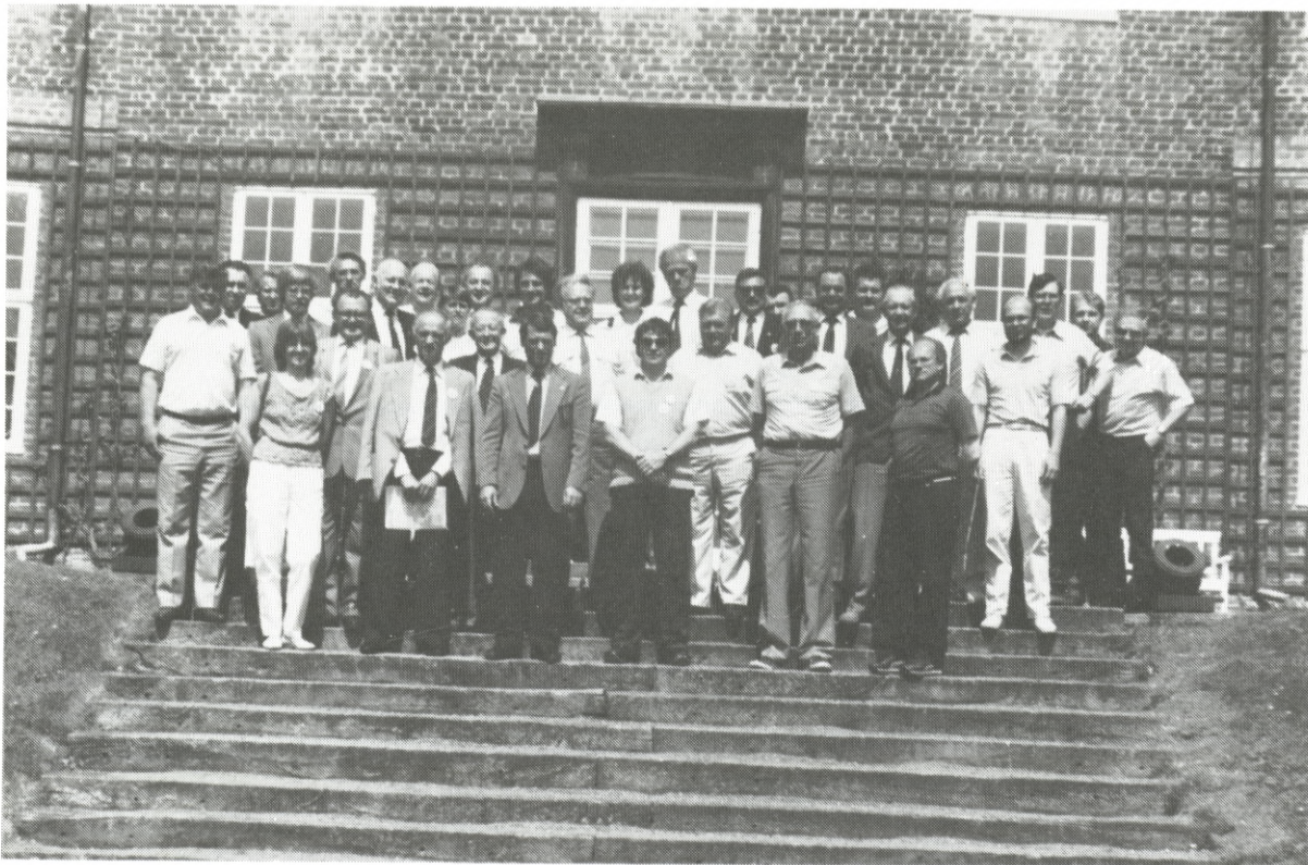
Deltagerne i den europæiske firmaidrætskonference i Middelfart 1985.