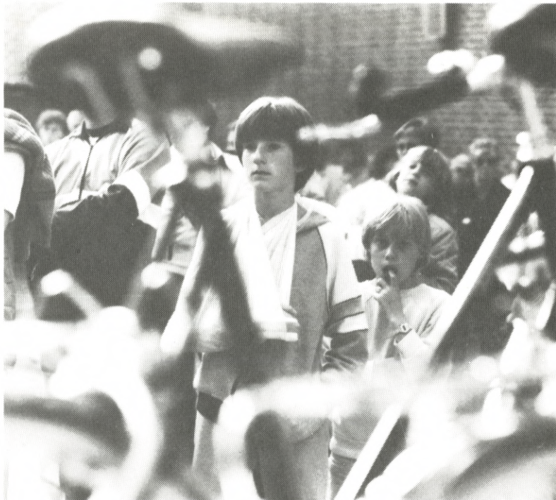
Der var som sædvanlig mange mennesker, der overværede den officielle afslutning af CYKL' 84 kampagnen. På det øverste billede tager den lille pige med stor beundring de 3 flotte PUCH-cykler i øjesyn, som ved lodtrækning blandt deltagerne landet over var gået til Grindsted ud af 25 udsatte cykler.