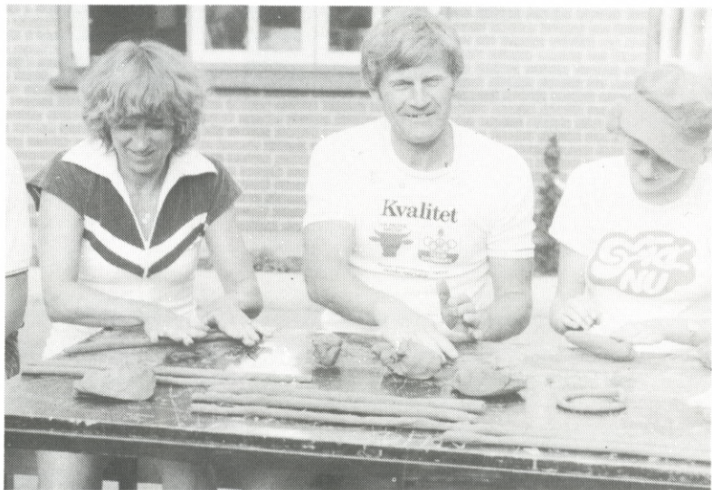
Lejrdeltagerne forsøger selv med lerarbejder.

En af deltagerne i lejren forsøger sig med at karte uld.