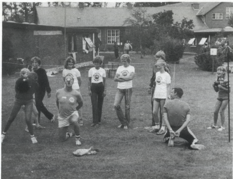
De mange indlagte lege og konkurrencer var sjove og spændende, og der blev gået til opgaverne med stor iver og opfindsomhed.

Man måtte vel forudse en del sprogproblemer de forskellige folkeslag imellem, men det gik forbausende godt. Når ens tale bliver kombineret med tegn og andre mærkelige