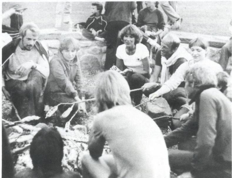
Der var trængsel ved lejrålet, da der skulle bages snobrød.

udenlandske familier kan nævnes: Kombibold (fodbold og håndbold på samme tid), Tal-bold løb (en ny form for boldleg), Minestaffet (en staffet med præcisionsspark), Holdbingo (en ny form for aktiv bingo), Bingoleg (også en ny kombinations-