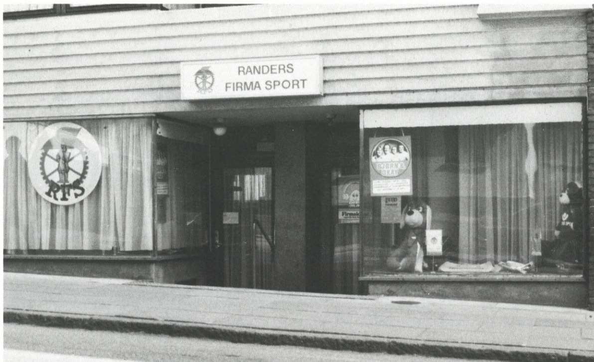
Bag denne facade har Randers Firma Sport sine lokaler

Sammenslutning. I 1959 ændrede man navn til Randers Firma Sport, som også er sammenslutningens navn i dag.