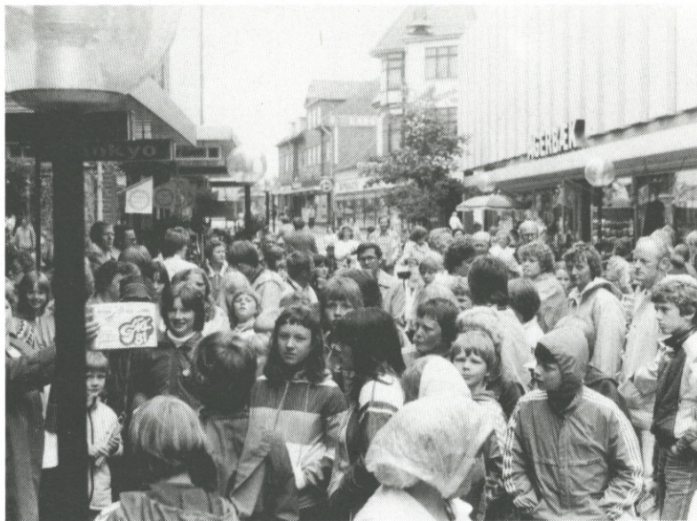
Efter fotoløbet var der stor trængsel i gågaden, indtil vindernavnene var blevet offentliggjort

Vi afviklede vor Cykl' safari i øsende regnvej, og alligevel samlede vi ca. 175 deltagere midt i forretningernes åbningstid. Vi fik mange rosende ord fra deltagere og fotohand-