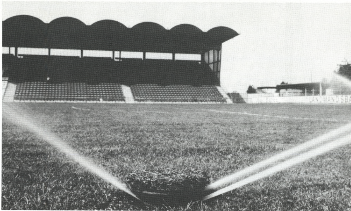
S-48's vandingsaggregater er kun synlige om natten, når der vandes...