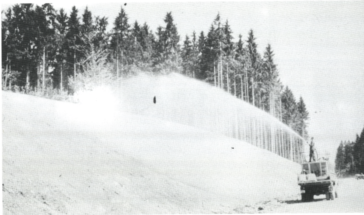
Den mobile »kanon« sprøjter græsfrø og bindemidler ud over den stejle vejskrænt – fra fod til top.

Nu var der fart på. Den voldsom- me ekspansion på baneområdet be- tød, at selskabet måtte tage endnu en aktivitet op – vedligehold af græs- boldbaner. Der så trak vedligehold af grønne områder ved industrianlæg og boligbyggeri med ind i billedet.