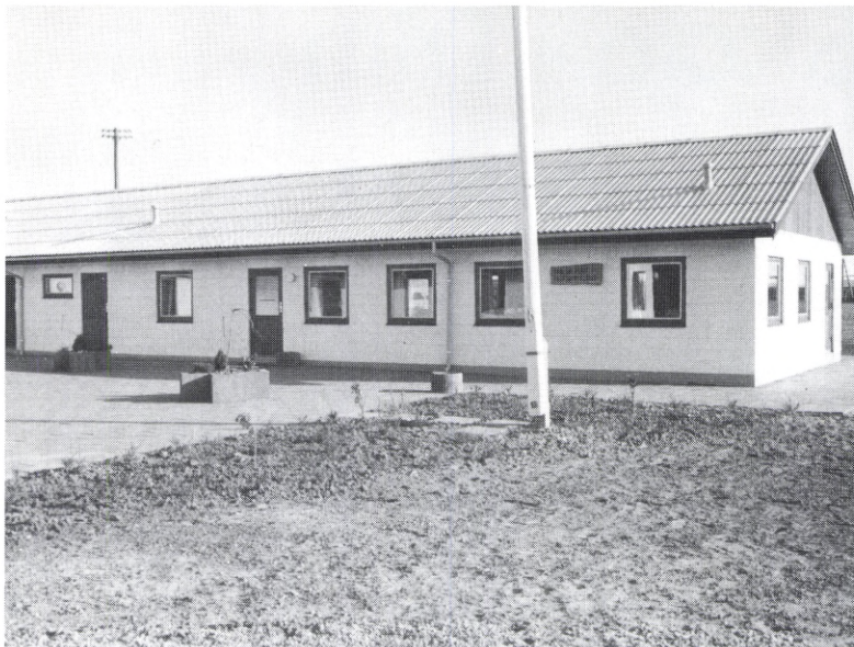
Det øverste billede viser den nye tilbygning, der er på 200m 2 . Det nederste billede viser klubhuset i sin helhed.