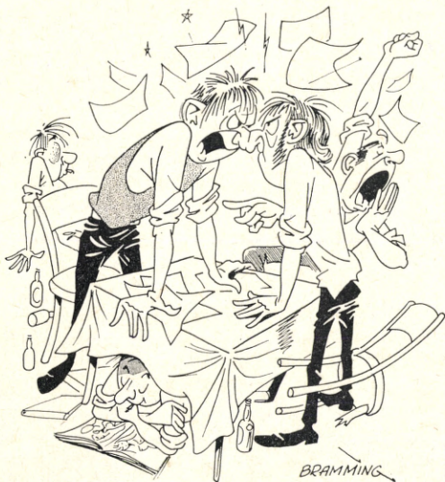
Forskellige opfattelser af, hvordan kredsarbejdet skal være, angives at være en af årsagerne til ønsket om en kredsdeling.

For en udenforstående virker det meget drastisk, at man på grund af mentalitetsforskelle og manglende samarbejds muligheder griber til så vidtgående midler som at dele en kreds. Men kredsen har nu haft 3 formænd siden oprettelsen, og ingen – det indrømmede den hidtidige formand – havde formået at få Sjællandskredsen til at »køre« på rette måde. Nu er der imidlertid fra begge kredse udtrykt håb om, at der kan etableres et tæt samarbejde sammenslutningerne imellem indenfor de to nye kredse, og med snarlige udvidelses muligheder, idet der mange steder på Sjælland og på Lolland-Falster dyrkes firmaidræt uden for forbundets rammer.