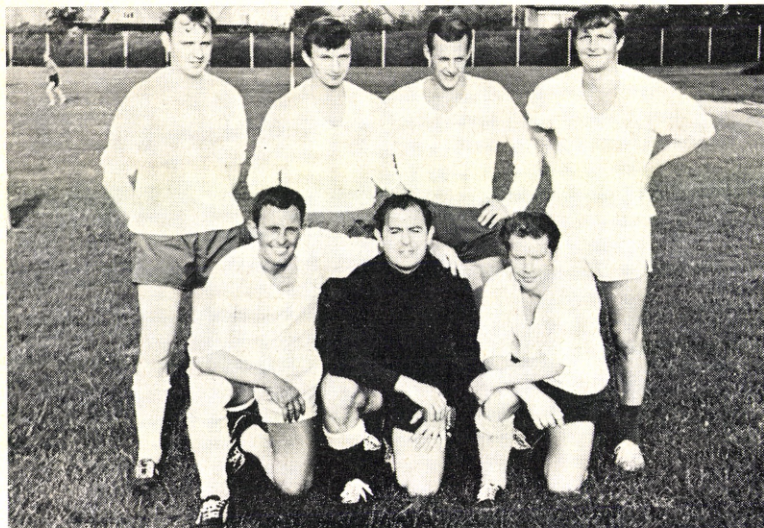
Det vindende hold af den bedste række i Vejen og Omegns Firmasports 7-mands fodboldturnering: Firmaklubben ALFA .