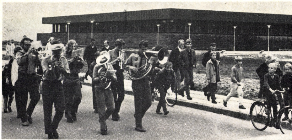
FDF-orkestret i spidsen for kampagnedeltagerne i Ringkøbing.