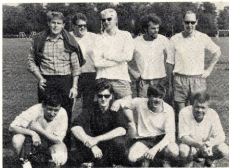
Nyvirke, Nyborg, landmestre i håndbold.