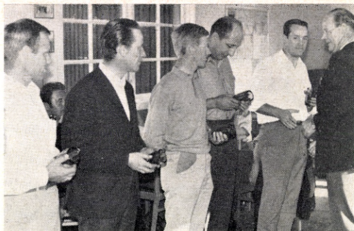
Skyttemestrene: Jydske Ingeniørregiment, Randers.