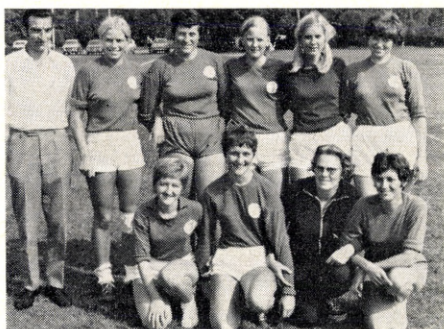
Jysk Telefon, Århus, vandt damehåndbold.