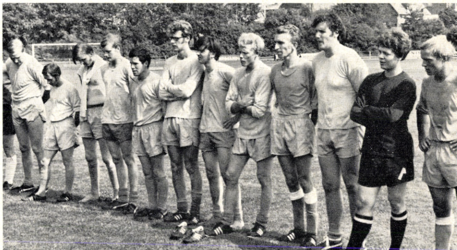
Ålborg Værft, trætte men fortjente landmestre i fodbold.