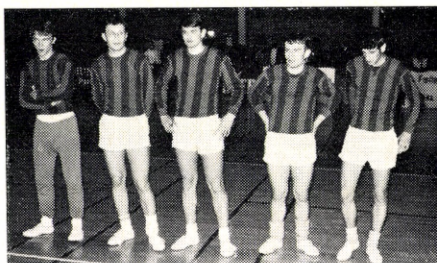
Sjællandsmestre i indefodbold: Køge Kommunale Klub.

Mødet var hurtigt overstået, og de to forslag fra bestyrelsen blev vedtaget med stort flertal. Vel nok det hårdeste var et forslag om et nyt medlemsystem, således at hver aktivt medlem i fremtiden skal betale kontingent direkte til KFB. Kontingentet udgør 20 kr. Det