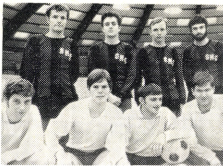
Finaleholdene fra det uofficielle automobil-mesterskab: SMC, Odense, og Bil-Centret, Kolding (kuelende).