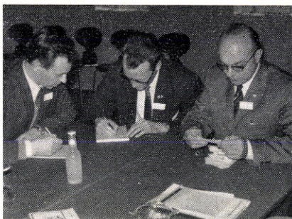
Stemmetællerne i arbejde.