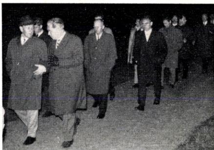
Næste hold på vej under „Sundhedskuren“.

Med denne vedtagelse var første afdeling af mødet tilendebragt. I tiden indtil spisningen og aftenfesten havde Køge Firma Bold arrangeret