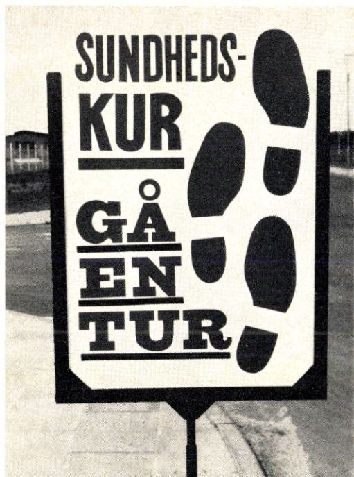
Gå-arrangementets motto kunne læses overalt i Esbjerg.