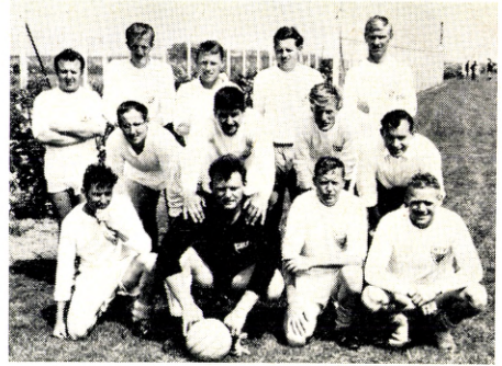
Murerne's Idrætsforening, Køge-mester for 2. år i træk.

I øvrigt skal der lyde en tak fra Køge Firma Bold til Esbjerg Firma Idræt for det fine arrangement af Firmaidrættens Dag. EFI skal have megen ros for det, og til vore modstandere i fodbold og håndbold skal lyde en tak for en god week-end. -ses.