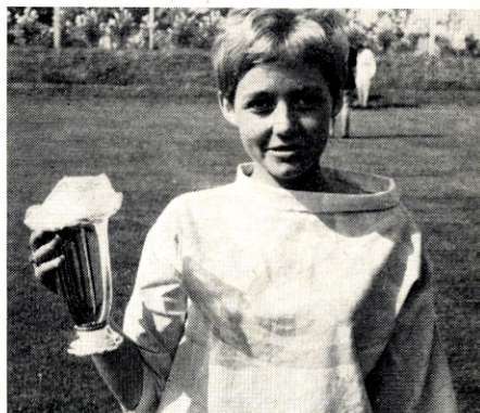
En sød repræsentant fra Audiola, Kolding, med trostpokalen for sidstepladsen i rækken.