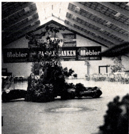
EFI-ballen var smukt pyntet til spisingen om søndagen.