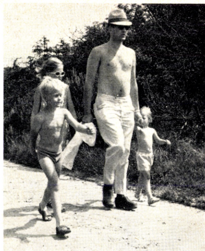
Selv lillesoster gennemførte turen på de 5 km, men så vankede der også en velfortjent is ved målet.