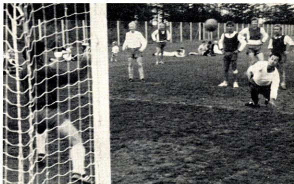
Dansk Melcentral, Odense, scorer på straffe i kampen mod Nielsen-Holst, Århus.