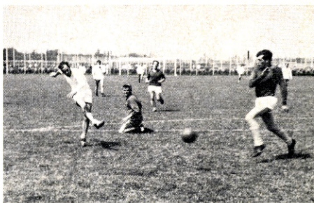
Et af stævnets flotteste mål scores her i kampen mellem Nyvirke, Nyborg, og Elektrogena, Kolding.