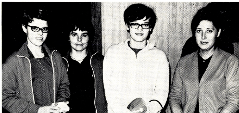
FIRE YNDIGE PRÆMIEVINDERE I DAMESINGLE