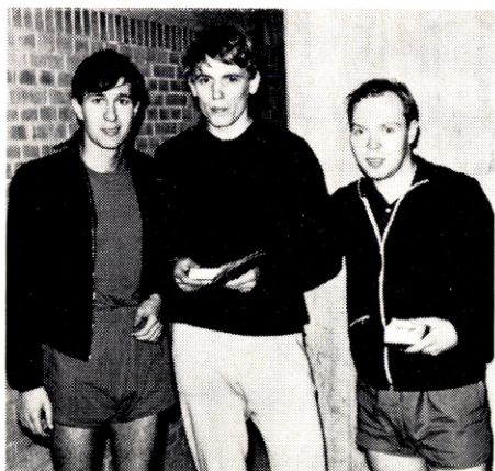
CODANS LANDSMESTRE I HOLDTURNERINGS