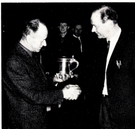
POINTSPOKALEN OVERRÆKES TIL EJENDOM