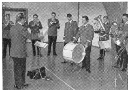
Postens orkester musicerede ved indvielsen.