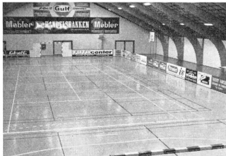
Hallen set fra dommerlogen.