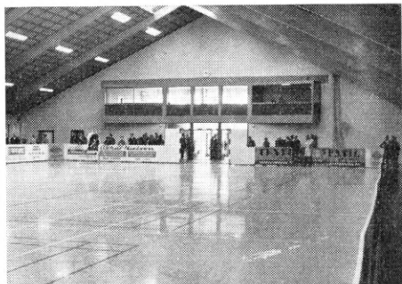
Hallen med restaurant og dommerloge.