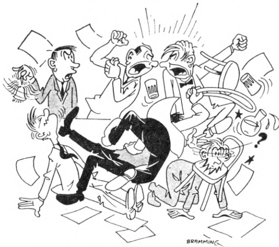
Dirigenten har ret til at bortvise mindre saglige deltagere fra generalforsamlingen.

Dirigenten skal sørge for, at talerne holder sig til det emne, der er sat under