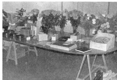
Et bugnende gavebord blev det i dagens løb.