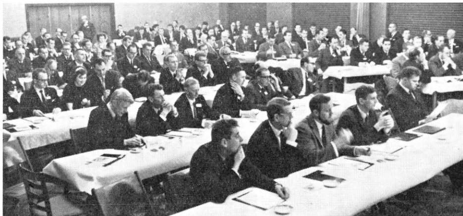
Forbundets vækst betød det hidtil største antal deltagere i et repræsentantskabsmøde.