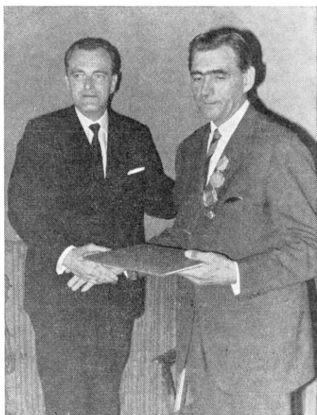
Den nye og den afgåede formand.

Med vore bedste ønsker for dig og din familie beder vi dig — som et synligt og varigt minde om kamp-årene i firmaidrættens tjeneste — modtage denne boggave, som vi håber vil kunne være til husværelse i kommende — mere fredfyldte stunder.