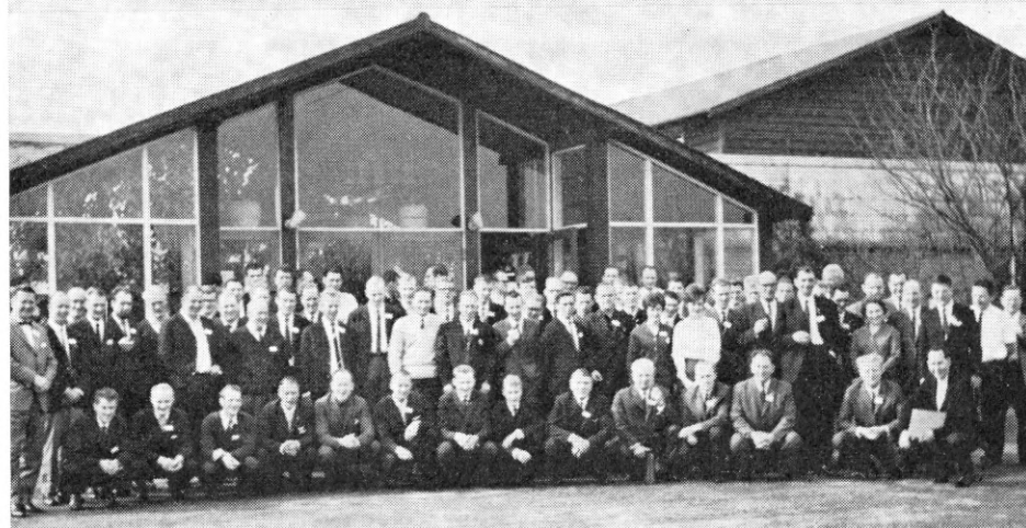
Fotos fra landskurset på »Søhus« præget af smil og intens medleven