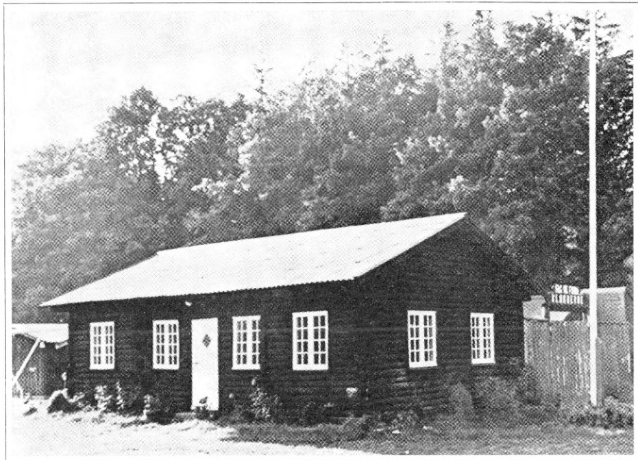
Klubhuset i Hannerup