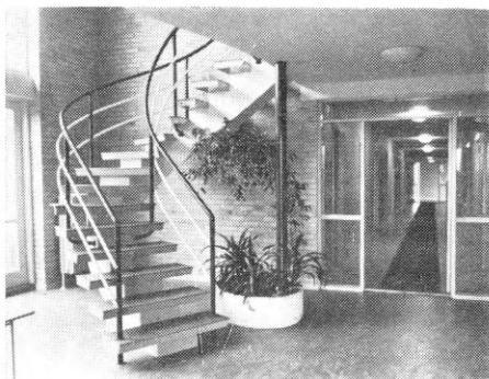
Interiør fra værelsesflojen.