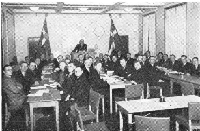
Fra det stiftende møde i Dansk Firmaidræts Forbund den 20. januar 1946

Det bør dog nævnes, at enkelte af forbundets organisationer er medlemmer af specialforbund under Dansk Idræts Forbund, ligesom enkelte af forbundets orga-