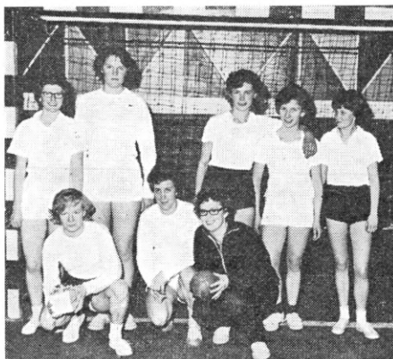
Det sejrende damehold, Flydedokken , Århus.

Flydedokken generobrede her mesterskabet ved at vinde så knebent som 6-5 i et opgør, der i spænding ikke gav herterne noget efter.