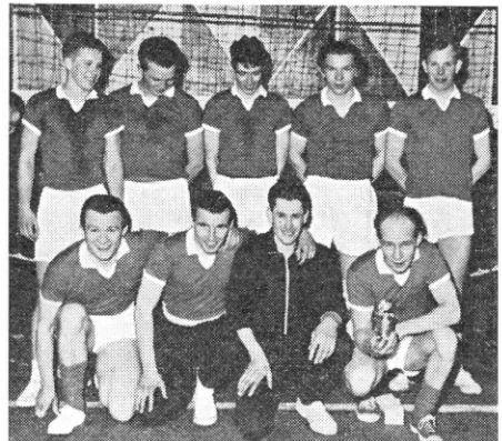
Herrerækkens sejrende hold, Åbenrå Andelsvineslagteri , DKSI.

Man var forskånet for enhver form for protester eller kritik, hvilket bør tjene til de deltagende holds ros. Der var bogstaveligt talt ingen nitter imellem, hvad stævnets jævnbyrdige resultater er et tyde-