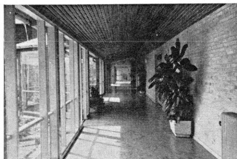
Interiør fra skolen