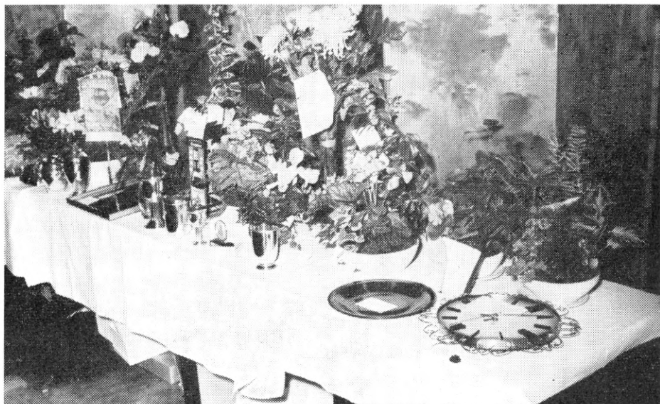
Gavebordet ved FKBU's 40 års-dag