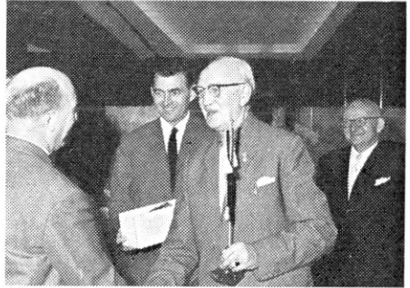
DFIF's lykønskninger overbringes af formanden og den ny formand

At man også udadtil har vundet anerkendelse for sit arbejde, derom vidnede den lange række af gratulanter, der mødte op ved formiddagens reception i „Karnappen“ medbringende et væld af