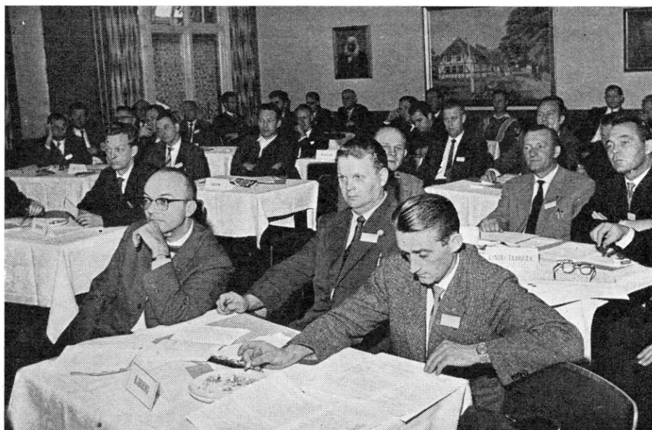
Et lille udsnit af repræsentantskabsmødets deltagere

Men også på andre måder var det en behagelig oplevelse at være til stede, idet mødets forhandlinger fra først til sidst prægedes af en prisværdig saglighed.