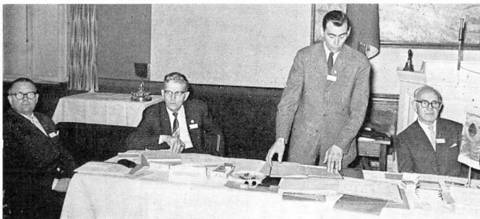
Kassereren aflægger regnskab

Det må betegnes som glædeligt, at „Dansk Idræts Forbund“s lægevejledninger nu også er åbne for vore klubber, og dette understreger det gode forhold, der stadig består mellem firmaidrætten og DIF's øverste ledelse.