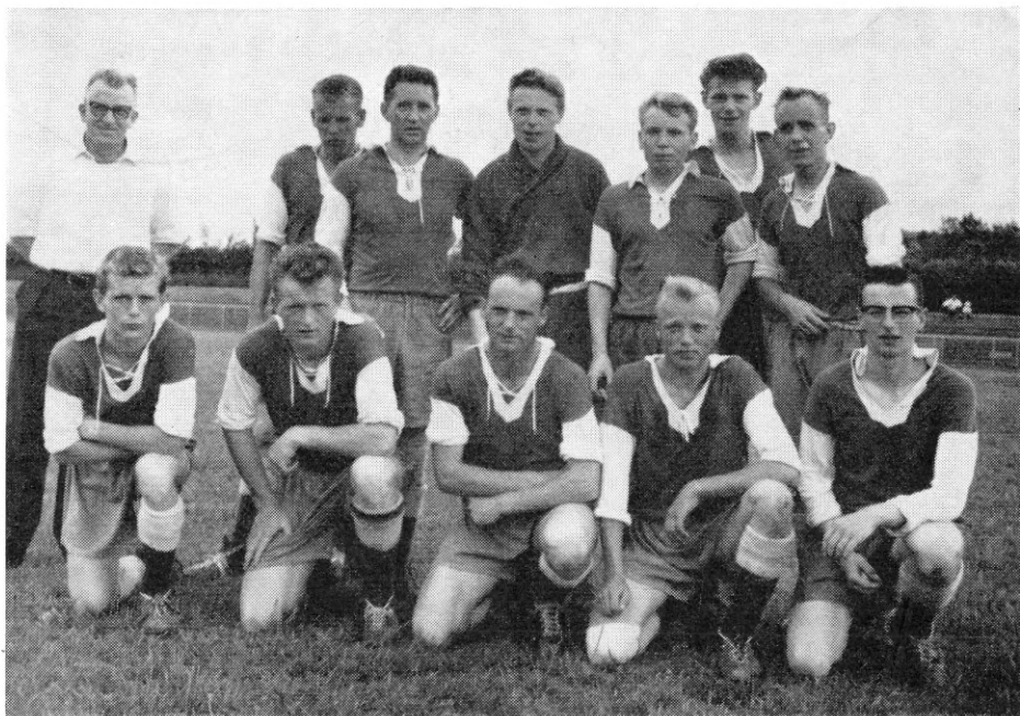
Esbjergs sejrende bold

Desværre tillader pladsen ikke at bringe noget referat fra de enkelte kampe,