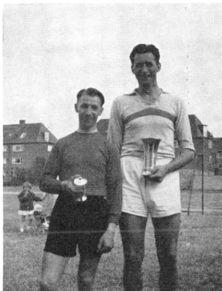
Det gamle mundheld om „en lille og vågen“ passer ikke altid

var overstået, vartede københavnerpigerne op med et ypperligt holdspil, og sejren blev på 4–1.