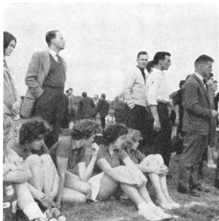
Blev der mål?

Finalekampen stod for damernes vedkommende mellem Kolding og Philips fra København som repræsentant for KFIU, og efter at den første nervøsitet