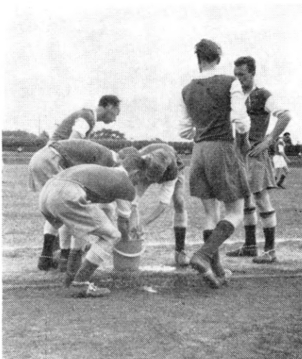
Når termometret viser 28 o er det godt med lidt koldt på panden i pausen

Der er imidlertid ingen tvivl om, at det var det absolut bedste hold, der vandt, og Esbjerg sikrede sig med sin sejr den 3. aktie i Jean Hersholt-pokalen, som det tilsyneladende bliver svært at fravriste de gæve vestjyder.