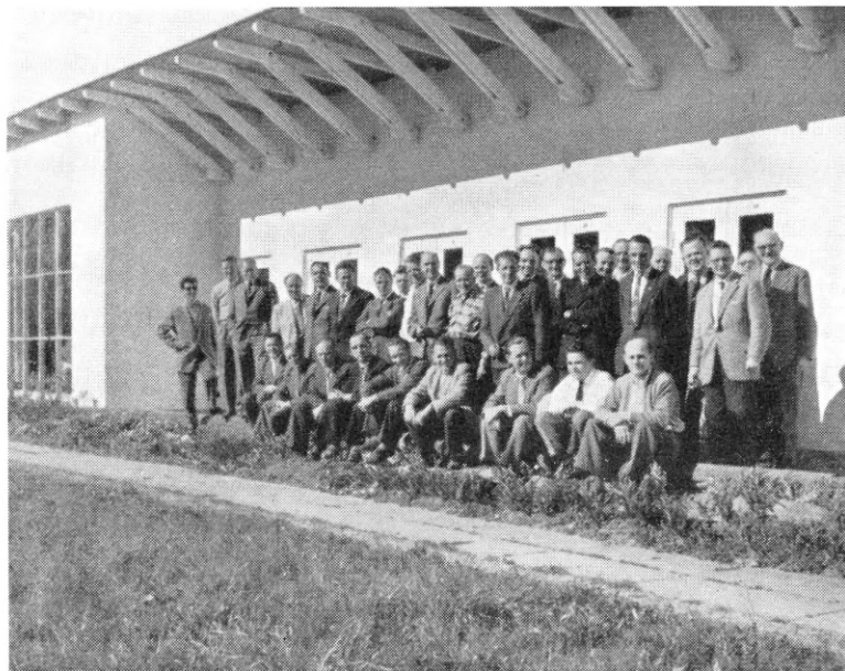
Deltagerne i DFIF's foreningsleder- kursus i Middelfart ferieby 24.-26. april 1959