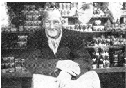
Ænder og gæs i rækker – fyldte bylder – og glade smil skaffer gode penge til byggefonden!

lertid kun forstand på fodbold (men til gengæld ikke så lidt!), så lad os andre erindre om, at på det andet felt, hvor DFIF har påtaget sig det landsomfattende arrangement, bordtennispillet, har man bestandig også været fremme i forreste række med holdmesterskabet i 1956 som et særligt karakteristisk eksempel herpå!