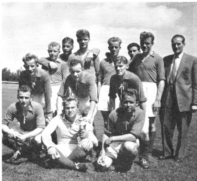
Århus udvalgte bold 1956. Vinder af DFIF's landsturnering i fodbold og „Hersholt-pokalen“