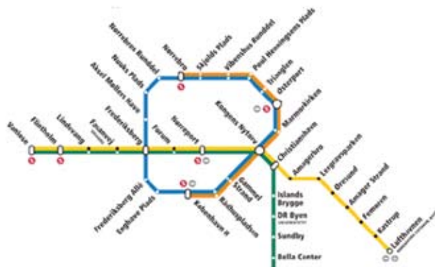
Illustration: Metrokort inklusive den nye Cityring, der er under bygning.