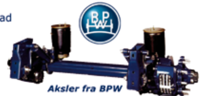
Aksler fra BPW